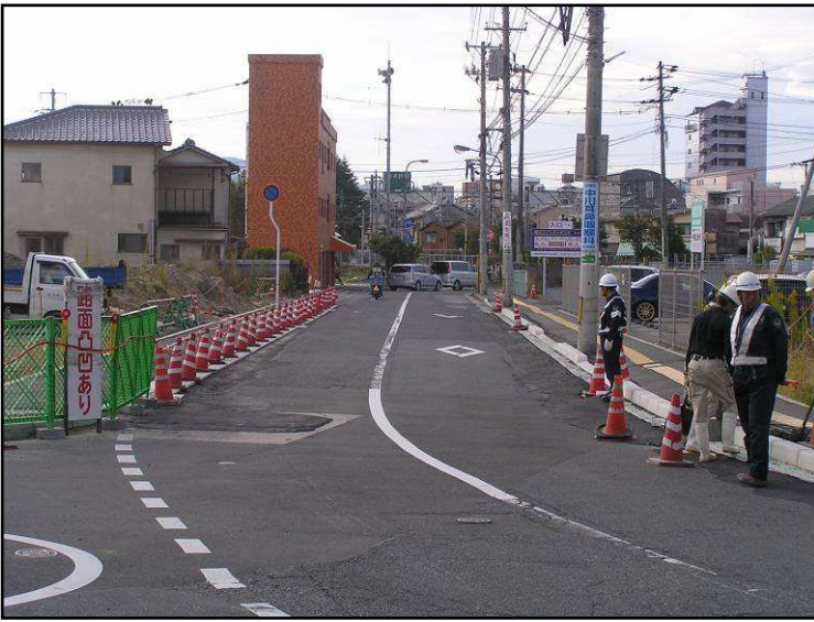
【青崎第10踏切に向かって撮影】