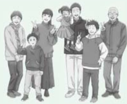
府中町PRキャラクター「椿町ファミリー」