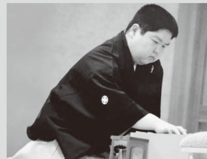
町出身の棋士 故・村山聖九段