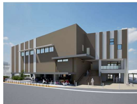
南公民館の建替イメージ

市制施行は、これまで住民が築いてきた地域の形が、市へ“昇格”することでもあり、住民にとって大変励みになります。このように、市制施行により地域への愛着を深め、住民の誇りの醸成に寄与することが期待できます。