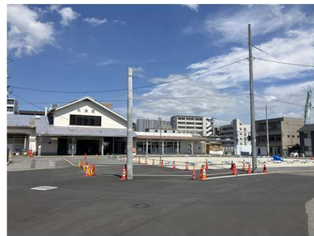
JR向洋駅周辺の様子

利便性や拠点性といった観点から、向洋駅周辺地区は企業誘致の有力な拠点であると考えられます。誘致には企業による認知が重要になるため、市制施行による都市的イメージの向上や認知度の向上は、大きな効果があると考えられます。