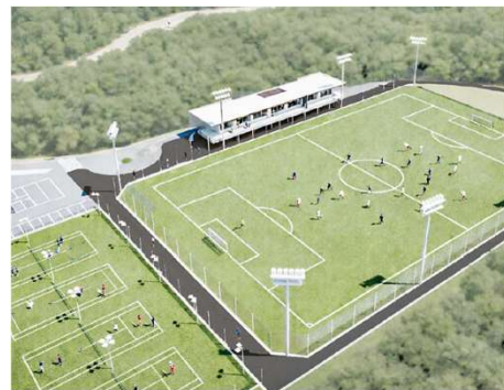
再整備のイメージ

市制施行による話題性や発信力の強化は、都市型産業であるプロスポーツチームによる発信の効果と相乗し、人口の維持や企業誘致についてさらなる効果を高めることが期待できます。