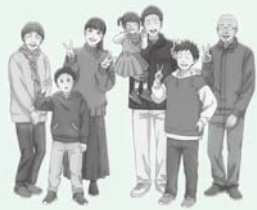
府中町PRキャラクター「椿町ファミリー」