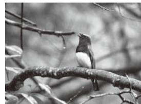
オオルリ