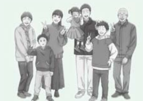
府中町PRキャラクター「椿町ファミリー」