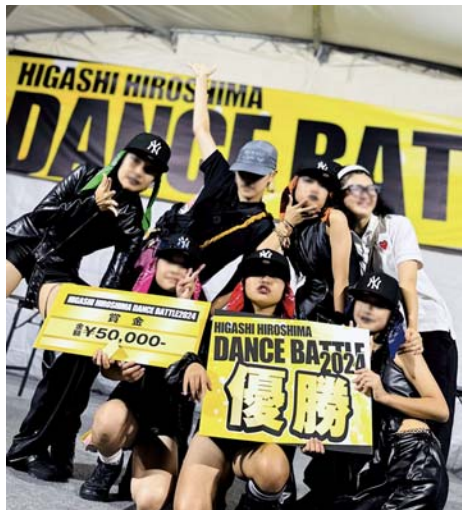
ダンスチームochibeeeeee時代♥にも参加(前列の右から2番目)