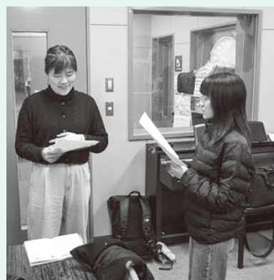
児童センターバンビーズでの収録の様子