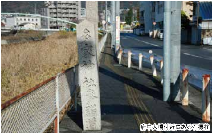
府中大橋付近にある石標柱

府中町役場前から多家神社までの榎川沿いにある松並木は、多家神社参詣道として明治初期に整備されたものです。両手をいっぱい広げても届かないくらい大きな松の木々が、町制を施行して80年経った今でも、府中町の発展と府中町民の暮らしを見守ってくれています。