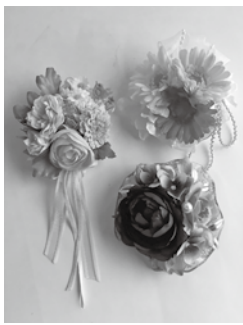
アーティシシャルフラワーで作ったコサージュ

時午前10時～11時30分 所府中公民館 小ホール 対未就園児の保護者(託児あり) 定15人(先着順) 申電話・来館で