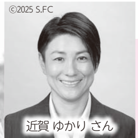
近賀 ゆかり さん