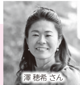
澤 穂希 さん