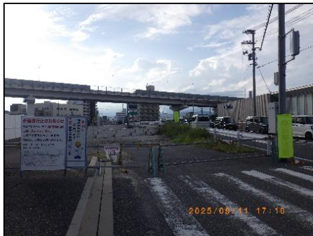
広島海田線 新大洲橋付近