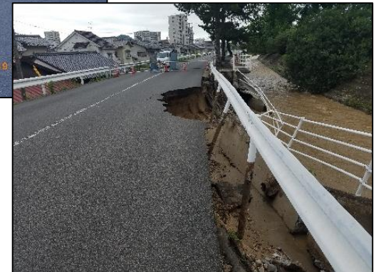
上宮町新地線 平成30年7月豪雨による 兼用護岸(左岸)被災状況