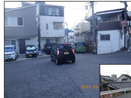
上宮町新地線 計画予定地 幅員狭あい部