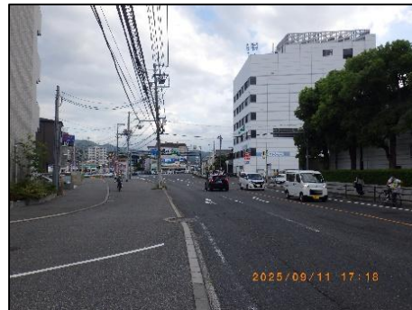
広島海田線 向洋駅付近