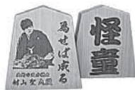
村山聖九段将棋駒