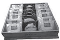
洋菓子詰め合わせ