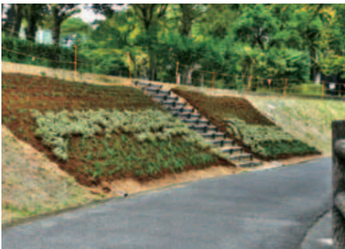
【府中町のスポットイベント】空城山公園はなのわ遊歩道ウォーキングコース内に来春に咲く花々を植栽しています。