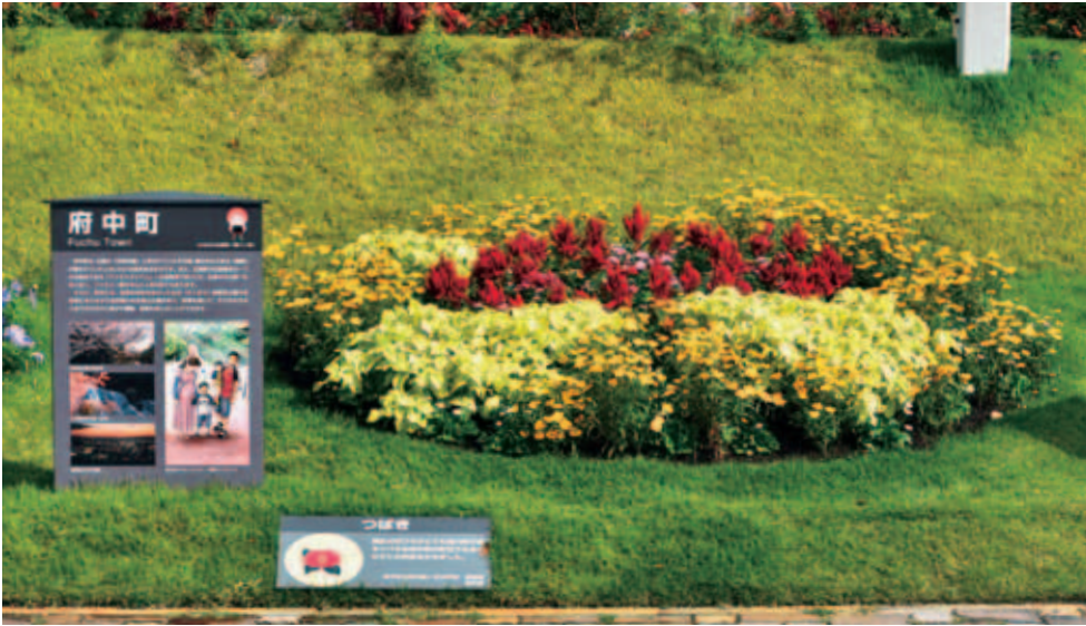
【緑ヶ丘中学校の作品】「つばきの花」 展示期間：9月19日～11月23日

「わがまち自慢花壇」は、県内二田で開催中の「ひろしまはなのわ2020」メイン会場（旧広島市民球場跡地）に展示されている中学生が考えた市町PR花壇です。町の花壇は、町立中学校の美術部の皆さんがデザインしてくれました。ぜひ一度ご覧ください。