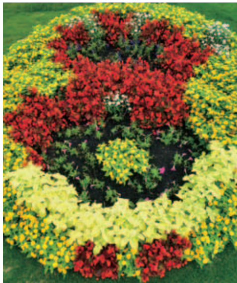
【府中中学校の作品】「つばきマン」 ※展示は終了しています。