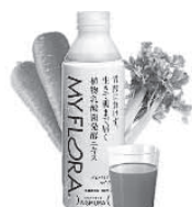
植物乳酸菌発酵エキス「マイ・フローラ」