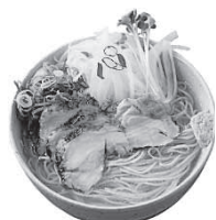
鶏そば お食事券 (3人分)

※登録申請書・募集要項は、府中町ホームページ（ふるさとふちゅう応援サイト）記念品提供事業者の募集 からダウンロードできます。