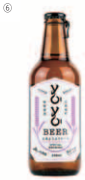
⑥【坂町】広島YOYOビール ¥660/酒商山田 ☎251-1013 /HP