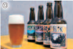
⑬【安芸太田町】安芸太田町オリジナル麦酒 ¥550/安芸乃国酒造株式会社 ☎0826-22-6523 /HP