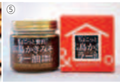
⑤【大竹市】広島かきみそラー油 ¥750/大竹特産ゆめ倶楽部 ☎・FAX0827-56-0666 /TEL/HP