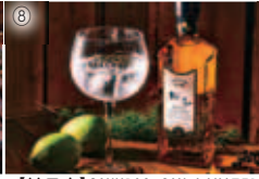
⑧【廿日市】SAKURAO GIN LIMITED ¥6,050/中国醸造 ☎0829-32-2111 /TEL