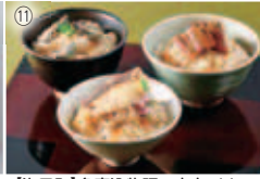
⑪【海田町】多喜込物語 広島めし三味(鯛・穴子・牡蠣) ¥1,296/魚食堂たわら ☎821-2037 /HP