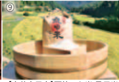
⑨【安芸高田市】天使のお米 桑田米 ¥2,400 (5kg) /桑田の庄 ☎0826-59-3010 /TEL