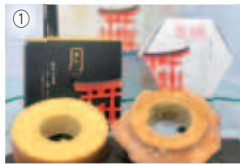
①【広島市】バームクーヘン「月・太陽」4号ギフト ¥2,160/樸kunugi ☎272-0001 /TEL/HP