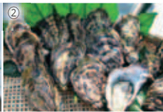
②【呉市】呉産かき ¥2,500~(時期等で変動)/呉産かき振興協議会 ☎090-4659-3414 /HP