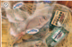
⑮【大崎上島町】お魚・海藻セット ¥5,000/フィッシングなかもむら ☎0846-64-4126 /TEL