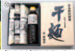
⑩【江田島市】天日乾麺うどん ¥2,948/迫製麺所 ☎0823-47-0254 /TEL