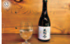
⑫【熊野町】大号令 ¥2,277/馬酒造場 ☎854-0104 /TEL