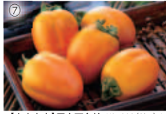
⑦【東広島市】原産西条柿 ¥3,000(3kg)/JA交流ひろばとれたて元気市となりの農家店 ☎437-5831 /TEL